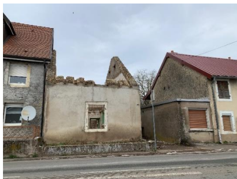
Destruction maison pour sécurisation

Le Maire présente aux conseillers des documents de synthèse relatant l'état des dépenses 2021, et plus spécialement les différents investissements de l'année au Centre du Village et dans la zone du Parc.