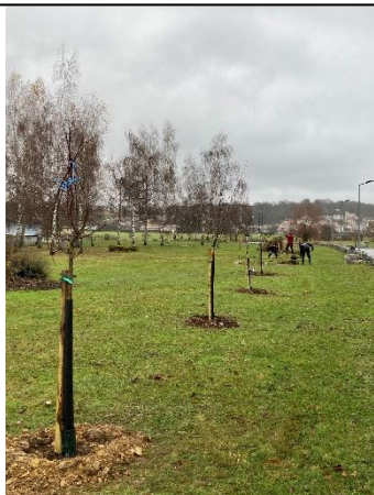
Plantation arbres fruitiers et pose de gabions