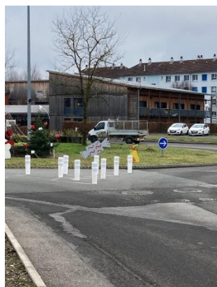
Réfection de voiries